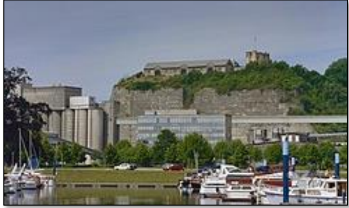
De bergwand van het geologisch monument 'Typelocatie Maastrichtien' met zicht op de torenruïne van kasteel Lichtenberg (rechtsboven) en het gebouwencomplex (links) van de ENCI