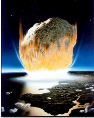
Artistieke impressie van het moment van de meteorietinslag K/Pg (Wikipedia)